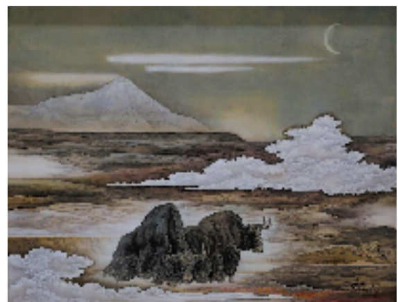
边巴 高原晨曦 110x100cm 中国画 2022年

唐卡,这一拥有1300多年历史的艺术形式,是中华民族弥足珍贵的非物质文化遗产。以天然矿物设色,取法自然,历久不褪。其构图遵循《造像量度经》,于严谨中见对称与韵律之美。唐卡融民族审美与工艺智慧于一体,题材涵盖历史传说、生活万象,被誉为藏民族文化的“移动壁画”,是中华民间艺术的璀璨瑰宝。与这份古老相映成趣的,是展厅中另一批以当代视角描绘高原的作品。西藏题材现当代美术作品以西藏自然人文为表现对象,既承传统神韵,又融现代艺术的技法与观念。它们是艺术的呈现,更是观察当代西藏的一扇窗。