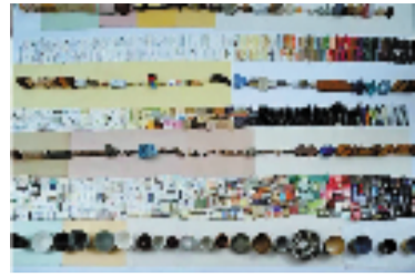
韩家英 辞典26(局部) 综合材质

韩家英生于中国当代设计转型的关键时期，又成长于80年代中国现代设计的新起点上。三十多年来，他始终围绕设计文化深水区的文字、图像及方法这一日常却又最具精神厚度的领域开展工作：从对基础的结构与书写逻辑出发，在文